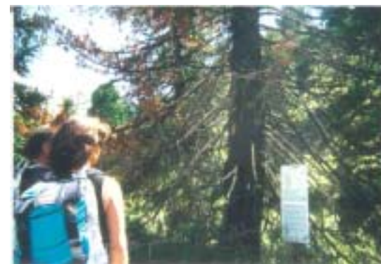
旅行者は足をとめ、とりつけられた解説版から、ガイドンスをうけることで意義やメッセージをうけとる。(スイスアレッツ地区)