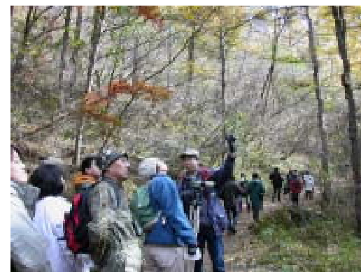
ガイドによるガイドンスをうけることにより、見るだけでは知りえなかった自然の仕組みに驚く(長野県軽井沢)